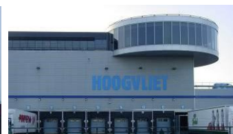
Stapelen (kantoorruimte) Alphen a/d Rijn – Rijnhaven

Niet alle vormen van zorgvuldig ruimtegebruik zijn voor elk bedrijf even goed haalbaar. De doelgroep voor Laarakker is breed: van handel en logistiek tot afvalverwerking en industrie. De mogelijkheden voor deze bedrijven zijn sterk verschillend. Voor een bedrijf met veel binnenopslag is het verhogen van de bedrijfsruimte bijvoorbeeld een goede optie, voor logistieke bedrijven is gezamenlijke parkeer- en manoeuvreerruimte weer een interessante optie. Ook kunnen deze bedrijven aan elkaar worden geschakeld, in het middengebied van het terrein is dit mogelijk. Voor alle bedrijven met een deel kantoorruimte geldt dat deze kantoorruimte goed bovenop de bedrijfshal kan worden geplaatst (stapelen). Bij bedrijven met veel buitenopslag, bijvoorbeeld afvalverwerking, zijn de intensiveringsmogelijkheden vaak veel beperkter. Door de grote verschillen per bedrijf is het van belang om voldoende flexibiliteit te bieden in de maatregelen, zodat