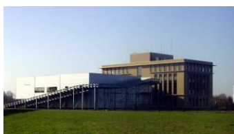
Parkeren op dak Den Bosch – De Brand

Een zorgvuldiger ruimtegebruik kan op uiteenlopende manieren worden gerealiseerd, bijvoorbeeld door te stapelen (bedrijfs-/kantoorruimte in meerdere verdiepingen), schakelen van bedrijfsgebouwen, ondergronds bouwen (bijvoorbeeld van de parkeerplekken), parkeren op het dak en een extra hoge verdiepingshoogte (meer inhoud). Het is ook mogelijk om in de constructie alvast rekening te houden met toekomstige uitbreiding met een tweede bouwlaag. Tot slot ontstaat met het delen van ruimte ook zorgvuldig ruimtegebruik, bijvoorbeeld door op de gedeelde ruimte gezamenlijke parkeerplekken, restaurant, opslag of ruimte voor afval te realiseren. Deze vormen van zorgvuldig ruimtegebruik hebben wij in een korte omschrijving in de bijlage verder toegelicht.