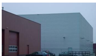
Verhoogde bedrijfshal Houten – Het Rondeel