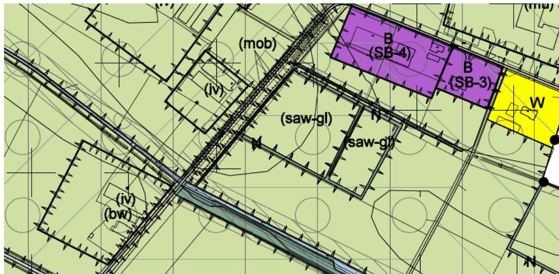
Uitsnede ontwerpbestemmingsplan Buitengebied 2010: gebied rond Elstweg 40-42 te Beers.

De locatie Elstweg 40-42 is gelegen in het log Beers-west. Voor deze locatie is in het geldend bestemmingsplan Buitengebied Cuijk 1998 een gekoppeld agrarisch bouwvlak opgenomen. Ondernemer wil dit bouwvlak uitbreiden van 1,61 ha tot 2,46 ha. Bij brief van 15 mei 2009 is ondernemer bericht dat ons college een principebesluit gericht op planologische medewerking heeft genomen. In de door de initiatiefnemer overgelegde ruimtelijke onderbouwing wordt aangegeven dat voldaan wordt aan de gestelde eisen inzake optimaal ruimtegebruik, landschappelijke inpassing en ruimtelijke en milieuhygiënische aanvaardbaarheid.