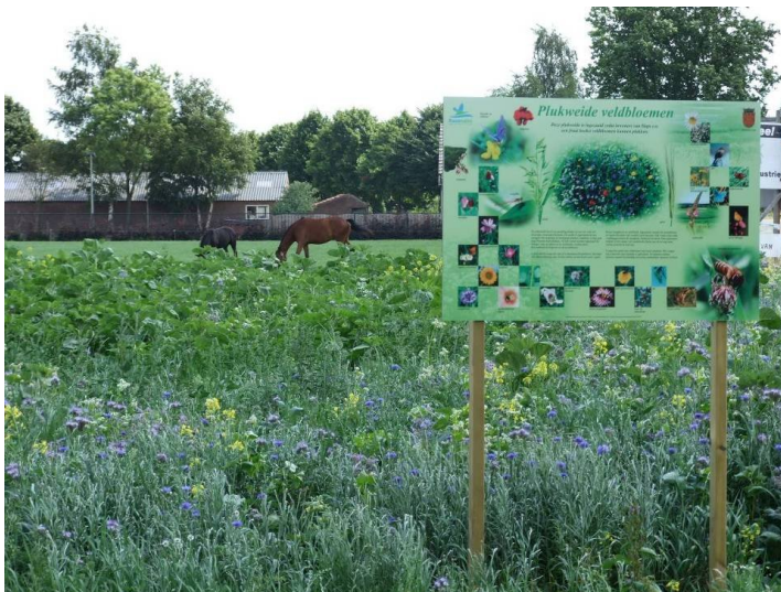
De plukweide in Haps

Daarnaast zijn er in samenwerking met o.a. de ZLTO op verschillende locaties in de gemeente akkerranden ingezaaid met bloemen. Na evaluatie van deze activiteit heeft de werkgroep Natuur en Milieu de conclusie getrokken, dat gestimuleerd moet worden bloemrijke akkerranden niet langer dan twee jaar op eenzelfde plaats te houden. De ZLTO heeft ook het demonstratieperceel aan de Straatkantseweg in Haps met koolzaad ingezaaid. Deze activiteiten krijgen in 2009 een vervolg.