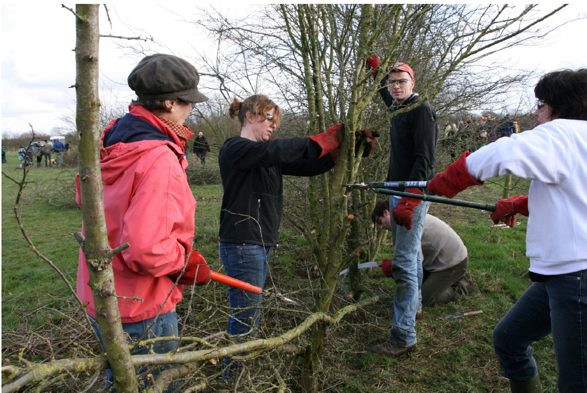
Op vele manieren wordt er gewerkt aan het herstel van de maasheggen. NK Maasheggenvlechten 2009; het team van de gemeente Cuijk aan de slag.

Daarnaast zijn er verschillende deelprojecten opgestart, die de uitvoering van de projecten mogelijk moet maken, o.a. op het gebied van kavelruil, grondverwerving, beheer en communicatie. In het kader van communicatie zijn twee voorlichtingsbijeenkomsten gehouden voor de bewoners van het projectgebied. In 2009 zal het IGP met voortvarendheid worden opgepakt en uitgevoerd.