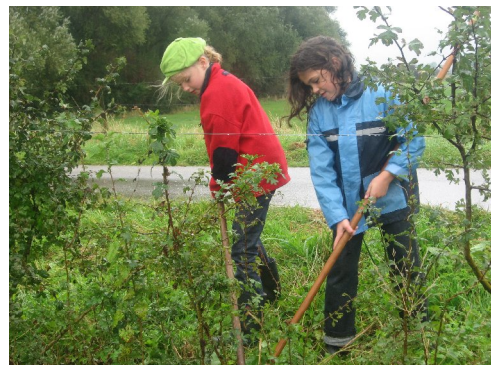
Maasheggenonderhoud door kinderen van de Lindekring.

De gemeente heeft de totstandkoming van het educatiepakket "de Heg" door de Stichting Heg en Landschap gesponsord. De basisschool De Lindekring in St. Agatha heeft hier met veel plezier gebruik van gemaakt en heeft op 16 maart 2006 een ruim 30 meter lange Maasheg geplant aan de Veerstraat. De school heeft de heg geadopteerd en heeft nu een soort meerjarige onderhoudsovereenkomst voor de heg. Elke maand wordt door enkele leerlingen met hulp van een maasheggenopa de heg onderhouden.