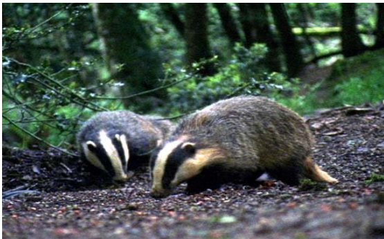
De das en zijn leefomgeving moeten goed beschermd worden.

Door het oprichten van het bedrijventerrein Laarakker verdwijnt dassenleefgebied. Hiervoor moet een dassencompensatieplan opgesteld worden. In 2008 heeft overleg plaatsgevonden met verschillende partijen. In 2008 is gebleken, dat de eerder gevonden bewoonde dassenburcht in het gebied nu niet meer bewoond is.