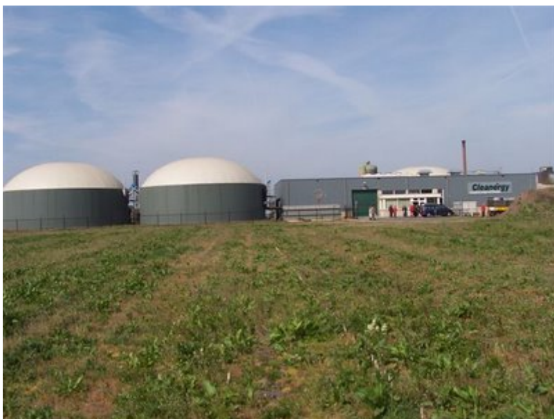
Figuur 4 – Vergistingsinstallatie van Cleanergy in Wanroy (36.000 ton mest/mais per jaar, 1 MWe vermogen)