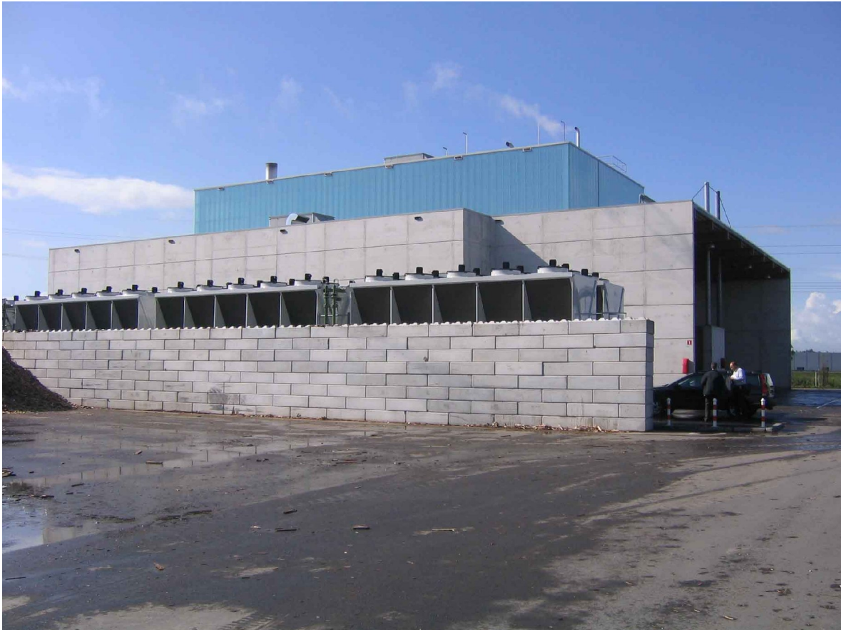
Figuur 1 – Voor- en zijaanzicht van de biomassacentrale van 1,5 MWe en 5 MWth van Bioenergie Twente in Goor