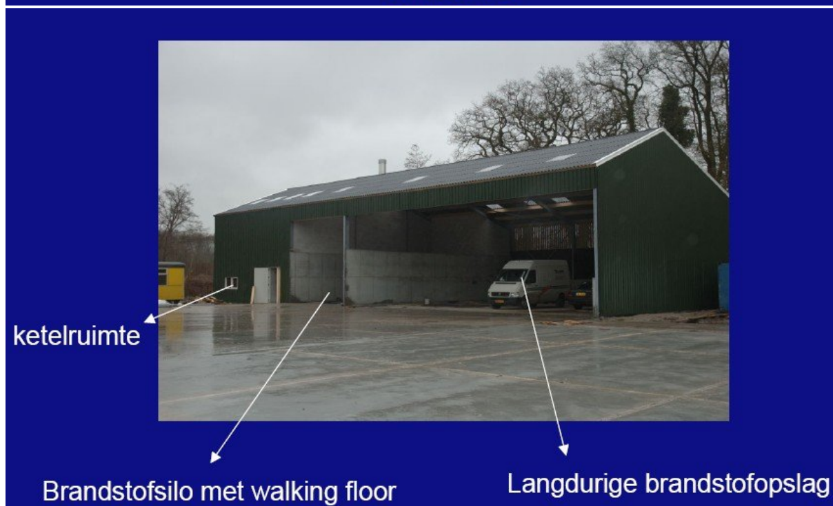
Figuur 2 – Voor- en achteraanzicht van de biomassacentrale van 1 MW voor warmtevoorziening in Beesterzwaag